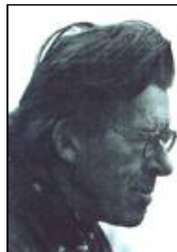
Peter Wessel Zapffe